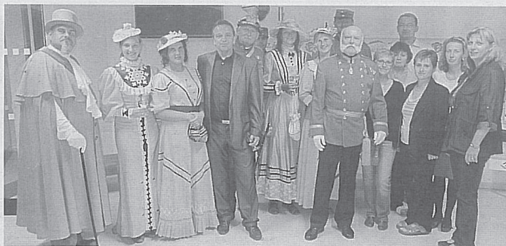
Slavnostního otevření zámku - Ekocentra Trkmanka byl přítomen i sám císař rakouský a apoštolský král uherský František Josef I. Vzácná návštěva v doprovodu svého kancléře, dvorních dam a důstojnického sboru se dostavila na základě srdečného pozvání starosty města Velké Pavlovice.

V únoru 2007 byl založen Letecký klub Nad krajem Andrě, který se letos zasloužil o své vlastní letiště na okraji města. I kulturní činnost je bohatá. Úspěšný je mužský Presuzní sbor, v prosinci oslaví své dlouholeté působení dechová hudba Starohorka. Oblíbená je country kapela Colorado, jejímž vdě-